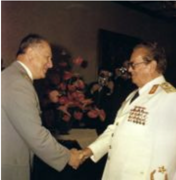
Генерал Никола Љубицић и Тито

га је ословљавала са "друже Тито". Титу сам отворено рекао да имам утисак да Јованка жели власт, на шта ми је он одговорио: "Ја не бих имао ништа против кад би она била за њу способна. Али, није способна".